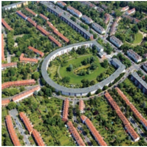
Mehrgeschossiger Siedlungsbau der 1920er und 1930er Jahre Leitbild: „Licht, Luft, Sonne“ (z. B. Hufeisensiedlung, Berlin)