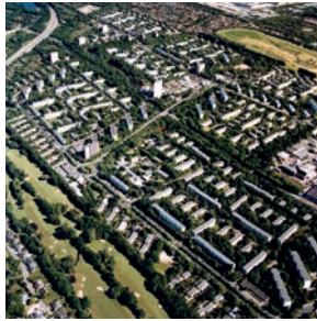
Mehrgeschossige Wohngebiete der 1950er und 1960er Jahre Leitbild: „Aufgelockerte Stadtlandschaft“ (z. B. Neue Vahr, Bremen)