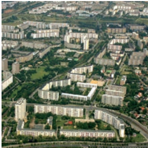
Wohngebiete der 1970er und 1980er Jahre in den neuen Bundesländern Leitbild: „Komplexer Wohnungsbau“ (z. B. Marzahn-Hellersdorf, Berlin)

Große Wohnsiedlungen sind vielfältig – die Handlungsbedarfe für die städtebauliche und soziale Weiterentwicklung unterschiedlich! Sie sind ein unverzichtbares Zukunftspotenzial der Stadtentwicklung und Wohnraumversorgung.