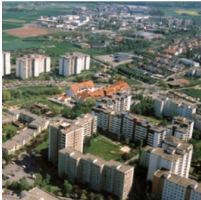
Vielgeschossige Wohnensembles der 1970er Jahre in den alten Bundesländern Leitbild: "Urbanität durch Dichte" (z. B. Spessartviertel, Dietzenbach)