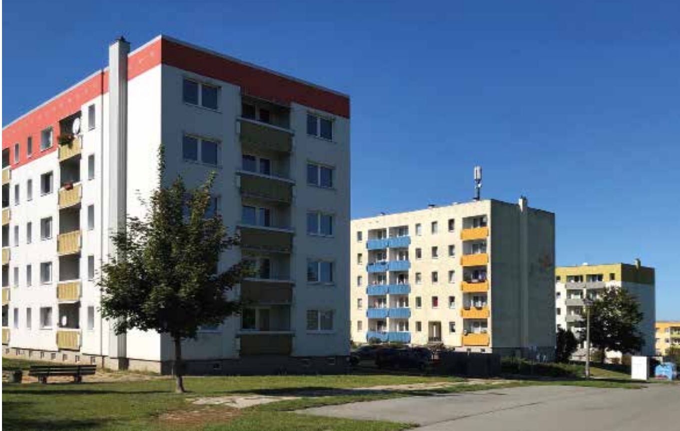
Typisches saniertes Wohnquartier am Rande der Kleinstadt Plau am See

Eigentümer aus der organisierten Wohnungswirtschaft leiteten jedoch schon kurz nach der Wende in vielen Beständen Erneuerungsmaßnahmen ein, die eine deutliche Steigerung der Wohnqualität und eine enorme Senkung des Energieverbrauchs bewirkten: neue wärmedämmte Fassaden, neue Heizungs- und Sanitärtechnik, kleinere Verbesserungen im Wohnumfeld. Grundhafte Veränderungen erfolgten kaum, ebenso wenig Ergänzungen der Quartiere durch Neubau.