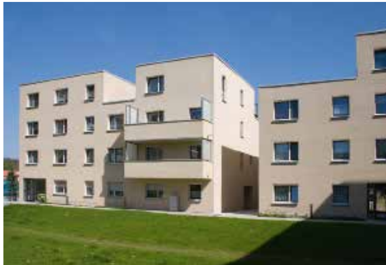
Im thüringischen Sondershausen wurde eine fünfgeschossige Wohnzeile zu einer differenzierten Hausfolge umgebaut

Wrumou etouaetouist, Santmfuga. Itatur deaera diorolpta etou- aetouist. Itatur diorolpta