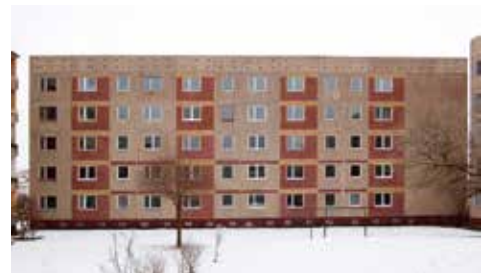
Der gleiche Wohnblock vor dem Umbau

ein zukunftsfähiges Niveau ist ebenso eine gesamtgesellschaftliche Aufgabe.