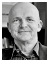
Dr. Bernd Hunger Kompetenzzentrum Großsiedlungen e. V. BERLIN

Wie auch in den größeren Städten erlebten die kleinen Großsiedlungen zunächst einen Imageverlust, korrespondierend mit dem Aufschwung des Eigenheimbaus, der sich gerade in den kleinen Städten und in den Dörfern manifestierte. Die professionellen