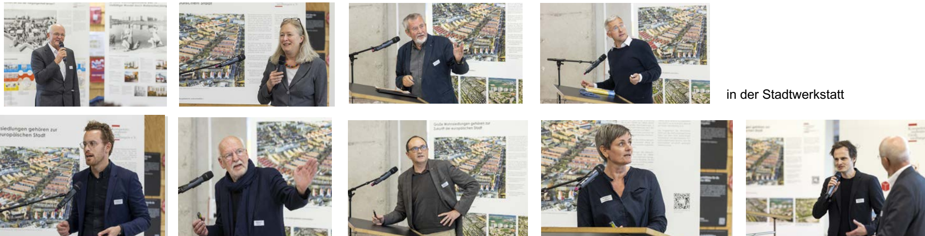
in der Stadtwerkstatt