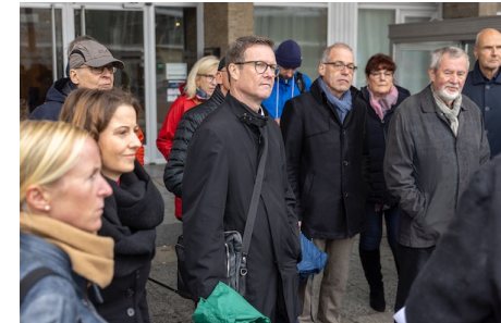
Besichtigungen der Großsiedlungen „Ernst-Thälmann-Park“ und „Karl-Marx-Allee“

Große Wohnsiedlungen >> Large housing areas >> Grands Ensembles >> Большие жилые районы >> Große Wohnsiedlungen >> Large housing areas >> Grands